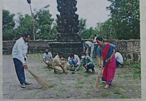
सासवड (ता. पुरंदर) : संगमेश्वर मंदिर परिसरात स्वच्छता करताना विद्यार्थी आणि शिक्षक.